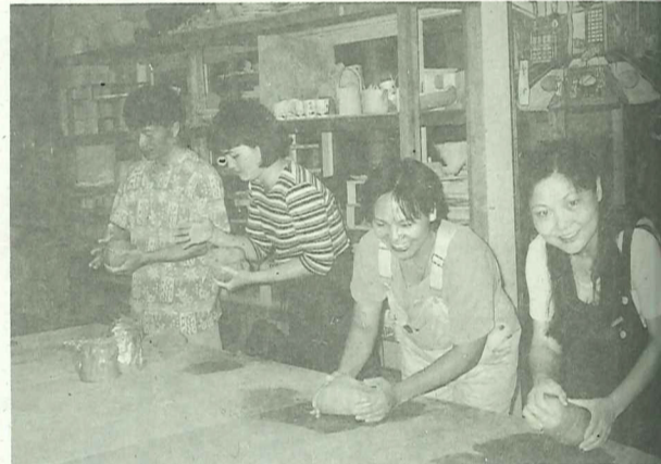
成人陶藝班反應熱烈學員以從基礎搬進階到第三期的課程

淡水文化基金會暑期才藝班擴大招生，即日起開始接受報名，此次開設的班級有：成人陶藝班（基礎/進階班）、兒童陶藝班（國小）、成人插花班（西洋花、小原流）、兒童書法班（國小三-六）、兒童美術班（國小三-六）、幼兒美術班（4足歲幼稚園以上）。有興趣者請洽：淡水鎮中正路161號報名，或電：2622-1928，傳真2620-2355。