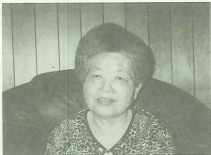
開朗健談的紀奶奶

可是在昭和十八年的時候，因為有空襲，物資採用配給制。所以多賣粥而少賣麵（因為炒麵所需要的材料較多）；而昭和十九年的時候，又因戰爭的緣故，休息了一年；直到昭和二十年才又繼續回來賣。