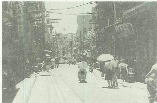
87年6月淡水中正路老街街景

淡水老街「街區再造」在軟硬體(自然、人文、建築)兼備的情形下，不是高度科技城市可以取代的。歷史街區再造是造福後代子孫的起點，尤其在目前鎮長睿智的領導下，必定有不同於以往的局面。我們期望藉著鎮長的誠意，時序調整，加上居民的支持，可以共同為這些即將消失的歷史建築創造另一種新的詮釋意義，更為淡水鎮締造出雙贏新局面。